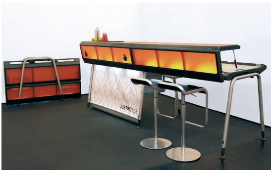
JUSTINCASE - aufgestellt

Kofferschale und Tresenrahmen aus Intergralschaum. Scharniere und Gelenke aus robustem Stahl. Strapazierfähige Arbeitsfläche aus Hochdrucklaminat. Tresenflächen aus hinterleuchtetem Acrylglas. Beine aus mattiertem Edelstahl.