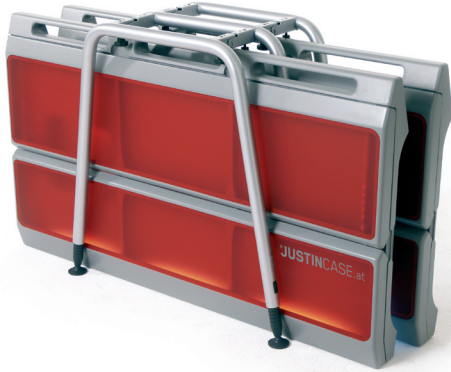
JUSTINCASE - transportfertig

Die mobile Bar JUSTINCASE mutiert für den Transport zu einer Art flight case. Das Möbel wiegt nur 29 kg, kann von einer Person getragen werden, passt in jeden Aufzug und lässt sich in einem kleinen PKW befördern. Die Bar lässt sich ganz einfach ohne Werkzeug aufbauen und ist in 5 Minuten betriebsbereit. Durch Anfügen von weiteren Elementen ist der Tresen seriell erweiterbar. Mit einem Niveaueausgleich von bis zu 10 cm ist auch eine Aufstellung auf unebenem Untergrund problemlos möglich.